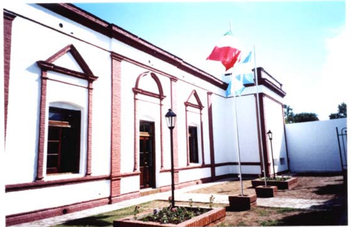
La nuova sede della Società Italiana "Umberto I" a Victorica

Dopo un breve cenno alla presenza degli immigrati italiani in tutti gli eventi storici della Repubblica Argentina, a cominciare dalla sua emancipazione nel 1810, Montezemolo ha sottolineato il suo compiacimento per avere mantenuto il nome di Umberto I a questa rinno-