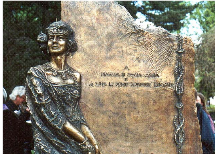
Primo piano del monumento dedicato alla Principessa Mafalda di Savoia, inaugurato a Como il 20 aprile 2002 (A. Casirati)

Mafalda di Savoia, assente da Roma in Bulgaria per i funerali di Re Boris III, consorte della sorella, la Regina Giovanna, decide di rientrare a Roma dove sono i suoi tre figli minori. Ma può essere un altro testimone pericoloso dell'iniziativa dell'Aprile 1943 del proprio marito Filippo d'Assia su Hitler per una trattativa con gli anglo-americani per salvare il salvabi-