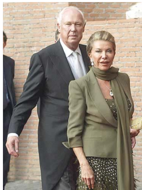
I Principi di Napoli all'arrivo in Basilica

In chiesa molte personalità, sia istituzionali sia della nobiltà romana, nazionale e internazionale.